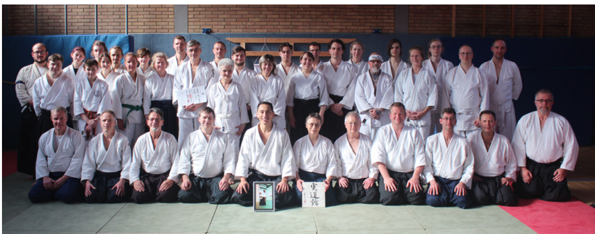
Teilnehmende mit Toyoda Sensei (5. von links)

Seit 10 Jahren gibt es Aikido im SV Groß Hesepe! Das haben wir im April mit einem großen Lehrgang gefeiert! Dazu ist der Präsident der Aikido Association International, Tatsuo Toyoda Sensei aus Chicago, angereist. Mit uns haben ca. 60 Aikidoka gefeiert und natürlich auch intensiv trainiert. Sie kamen aus Deutschland, aber auch aus Belgien (18 Teilnehmende!) und den USA. Vier Tage lang stand der Eschpark ganz im Zeichen des Aikido.